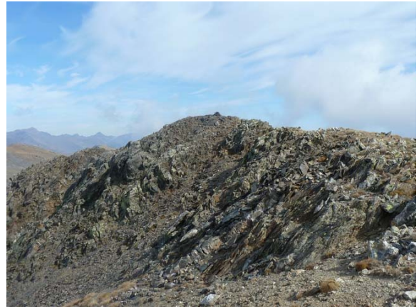
Pic de Salòria Oriental (2764m, 3h10m): en la majoria de mapes no el trobarem catalogat.

Des del Salòria Oriental, baixarem suaument fins al següent coll, que ens portarà, després d'una breu ascensió, al tercer cim: el Pic de Bassiets (2760m, 3h 50m) .