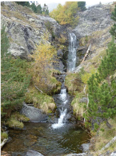
Barranc del riu Salòria

Un altre punt d'orientació és el barranc del riu Salòria, conegut des del principi de l'itinerari perquè el duiem a la dreta quan pujàvem. Per completar el descens, haurem d'anar-lo travessant buscant sempre els millors passos, i fins a trobar el Pla de la Cabana.