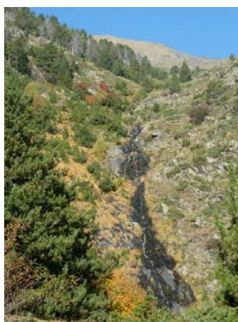
Barranc de Salòria que mantindrem a la dreta mentres pujem, amb el Pic de Bassiets al fons.