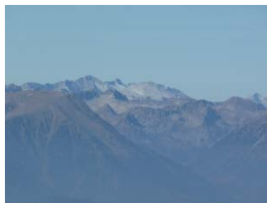
Oest: Massís de la Maladeta amb l'Aneto coronant la zona.