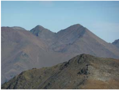
NordEst: el cim més alt d'Andorra, el Comapedrosa, amb el Pic de Baiau a l'esquerra i el forat dels malhiverns, formant el coll enmig.