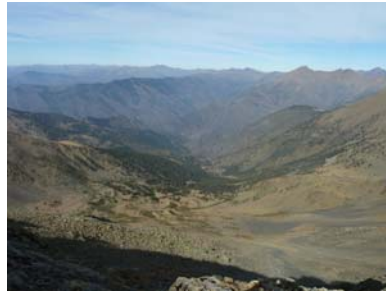
Nord: la vall de Tor als nostres peus.