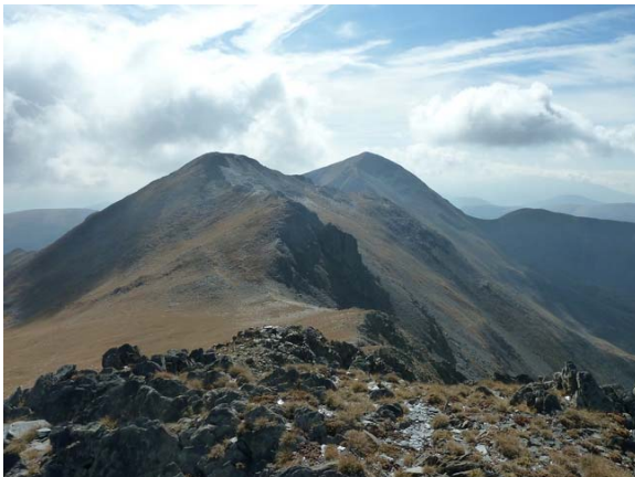
Mirant enrera, observem, des del Cim de Bassiets, el camí fet.

Des del Salòria Oriental, baixarem suaument fins al següent coll, que ens portarà, després d'una breu ascensió, al tercer cim: el Pic de Bassiets (2760m, 3h 50m) .