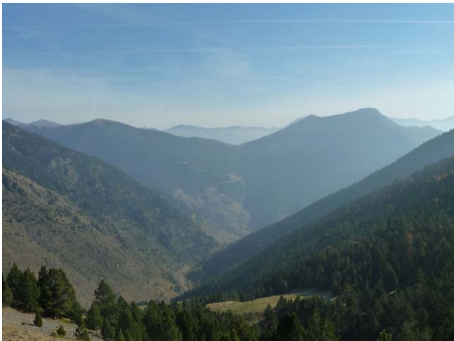
Panoràmica andorrana anterior des del Coll de Conflent, a 2.177,5m.

Coll de Conflent (2.177,50m, 1h 10m) : és una àmplia collada, als peus del Salòria, que dóna accés, amb vehicle tot terreny, a la Seu d'Urgell sense haver de passar per Andorra.