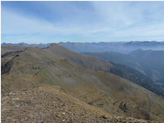
D'esquerra a dreta de la imatge: Salòria Oriental, Torre de Cabús i al fons, les muntanyes andorranes.

Cal advertir que a partir d'ara no trobarem el camí senyalitzat per cap franja indicativa. Caldrà tenir bona orientació, seguir les fites, i en cas que es disposi de GPS, del track adjunt. Continuarem cap a l'est, direcció al segon objectiu de la jornada (Salòria Oriental), parant molta atenció a la cresta existent entre els dos Salòries, evitant qualsevol risc i no recomanable per a qui tingui aversió a les altures.