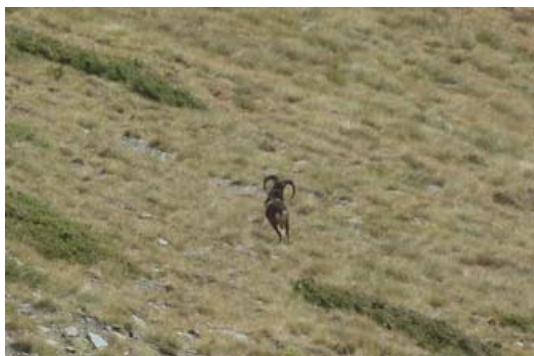
Mufló (Ovis gmelini): ovella salvatge de pelatge bru amb una franja blanca al centre del cos. Espècie exòtica introduïda a Andorra a principis dels anys 90 del s.XX.

Com a curiositat, en els prats d'aquesta travessa trobem una de les plantes més tòxiques dels Pirineus: és la Tora Blava ( Aconitum Napelius ), que, com el nom indica, fa unes flors amb forma de casc i d'un blau-violeta intens que les fa molt vistoses.