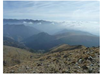
SudEst: Vistes d'on venim amb el Pla de la Cabana al fons.

Cal advertir que a partir d'ara no trobarem el camí senyalitzat per cap franja indicativa. Caldrà tenir bona orientació, seguir les fites, i en cas que es disposi de GPS, del track adjunt. Continuarem cap a l'est, direcció al segon objectiu de la jornada (Salòria Oriental), parant molta atenció a la cresta existent entre els dos Salòries, evitant qualsevol risc i no recomanable per a qui tingui aversió a les altures.