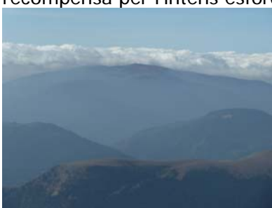
SudOest: per la zona del Port del Cantó, veiem el Pic de l'Orri Vell (2011m).

Al cap d'1 hora llarga de forta ascensió, arribarem al Pic o Bony de Salòria (2.788,8m., 2h30m) , des del qual tindrem unes magnifiques vistes a banda i banda, ja que en un dia de tardor com avui la visibilitat és excel.lent: una merescuda recompensa per l'intens esforç.