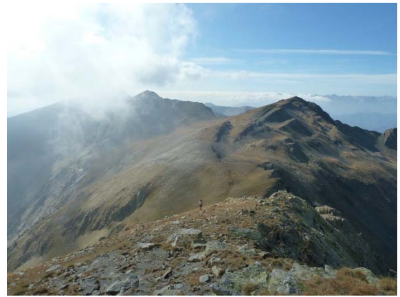
De camí cap a la Torre de Cabús, veiem tot el recorregut fet amb els dos Salòries al fons i el Bassiets en primer terme.