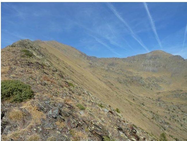
Al llom de la pala del Pic de Salòria, mirant cap al nord.

Mirant cap al NordOest, veurem una estaca (amb una franja groga) que ens indica el millor accés a la brusca pujada coneguda com a pala de Salòria, prèvia per arribar al cim.