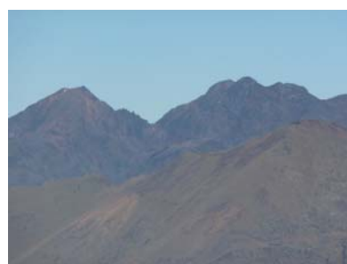
Nord: el Massís de la Pica d'Estats amb el Sotllo, el Verdaguer i la Pica.