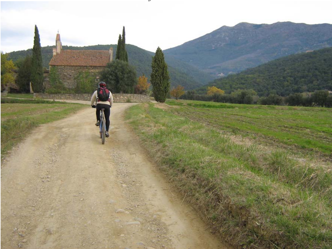
L'ermita de Sta. Magdalena i el Turó de l'Home