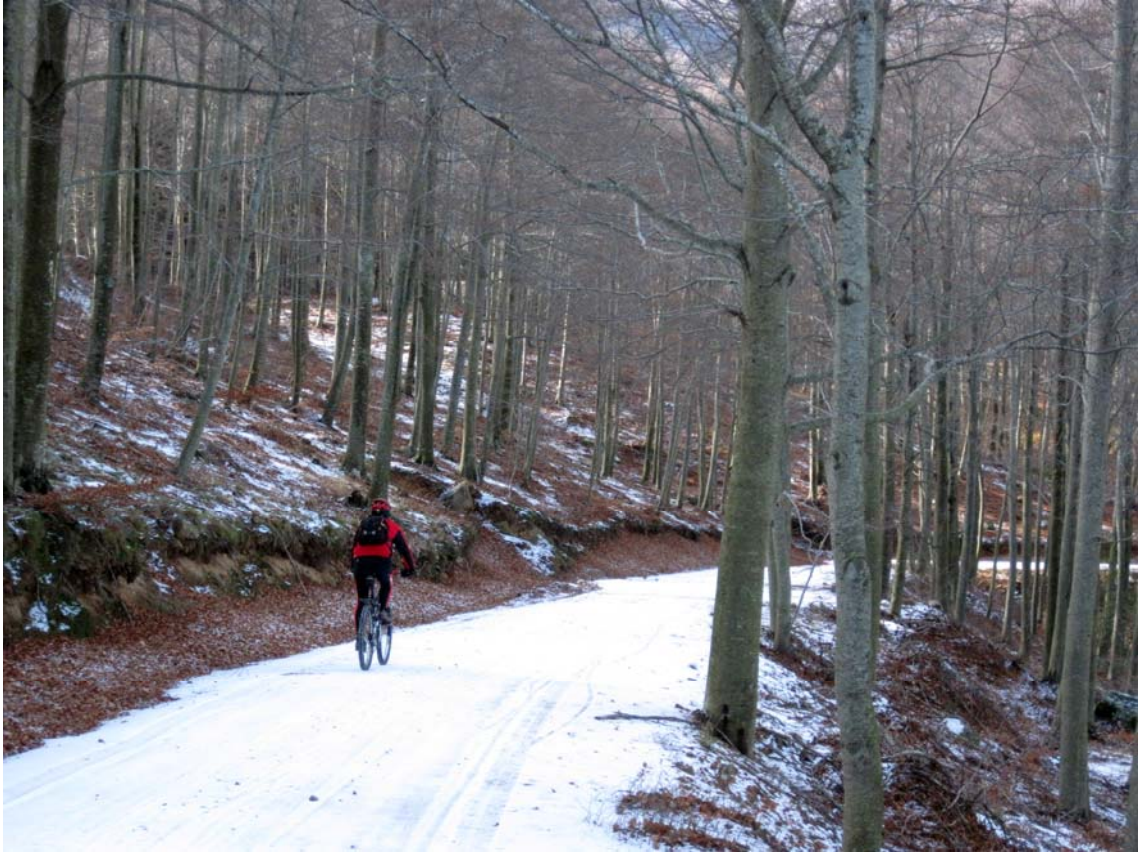
La pista de coll de Te entapissada amb neu tardorenca