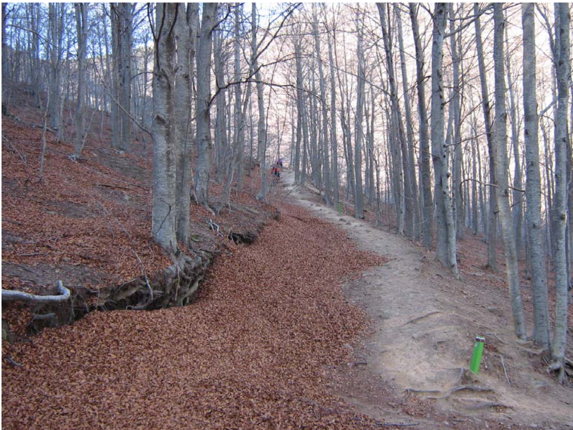
Baixant per la fageda cap a la font de Passavet