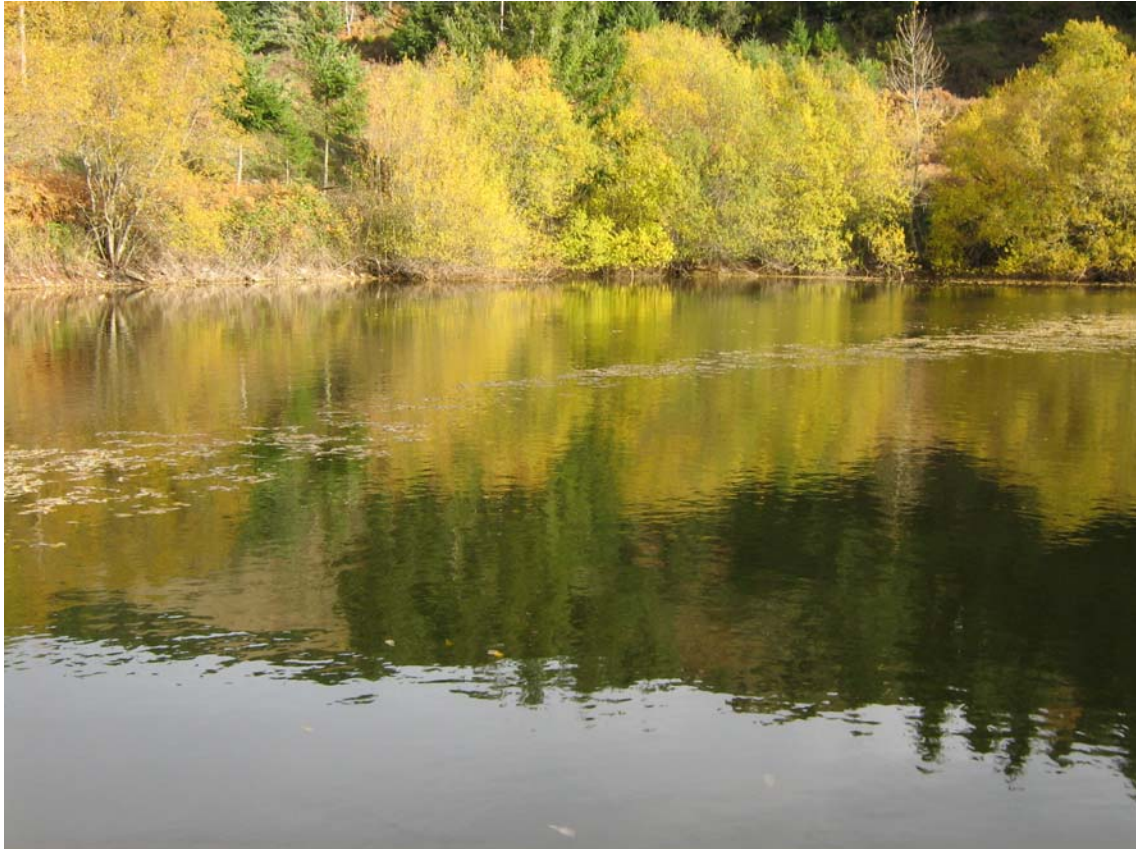
Els colors de la tardor guarneixen l'estanyet de Viada