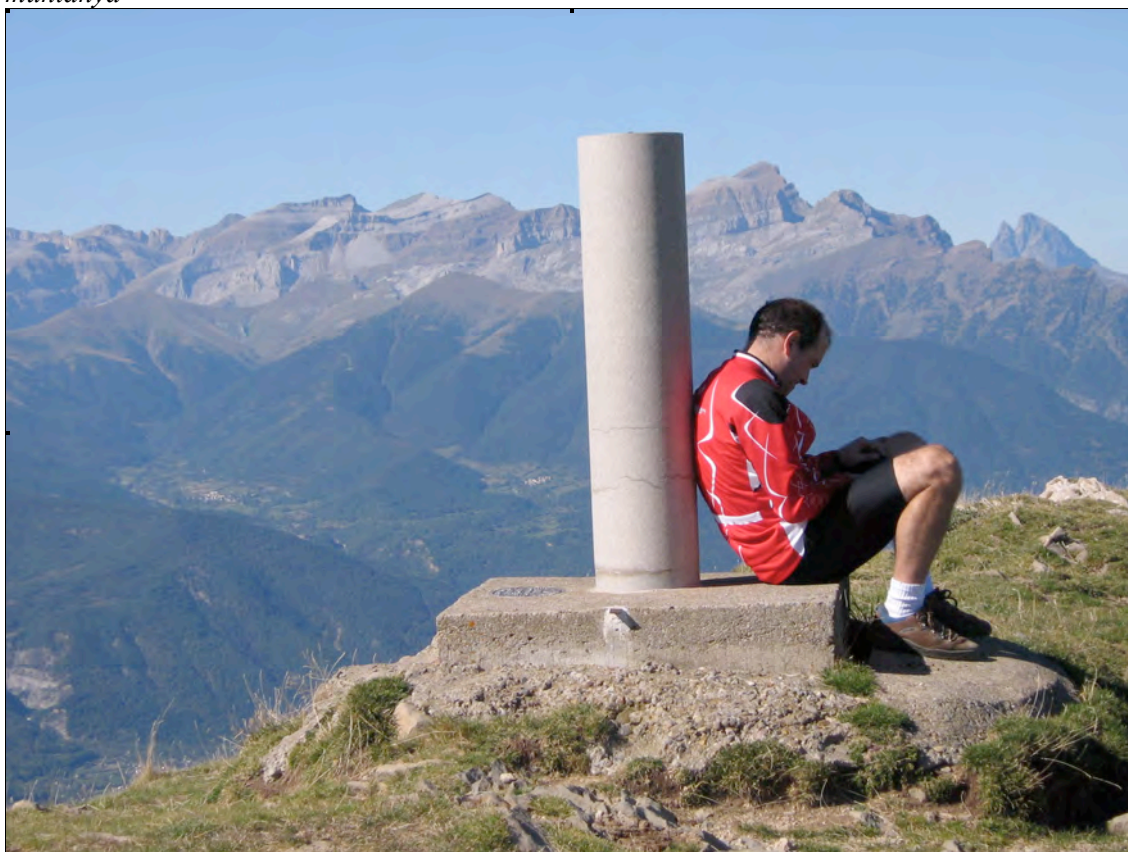
Dalt del cim del Peña Oturia, vèrtex geodèsic de primer ordre i excel·lent mirador dels Pirineus

La ruta que presentem transcorre majoritàriament per les terres del Sobrepuerto, una de les zones més feréstecs i deshabitades de la comarca del Serrablo, en el Prepirineu d'Osca. L'itinerari combina, amb simfonia, aspectes culturals, paisatgístics i esportius. Així podrem gaudir amb les nombroses esglésies d'estil mossàrab que hi trobarem, amb els seus paisatges variats, amb les excel·lents vistes sobre els Pirineus, especialment des del cim del Peña Oturia. Per una altra banda la llargada del recorregut, el seu fort desnivell i el poder atènyer un cim característic de la comarca, i un superb mirador, ben segur que deixarà ben satisfets als practicants més esportius d'aquesta magnífica forma d'excursionisme que és el ciclisme de muntanya