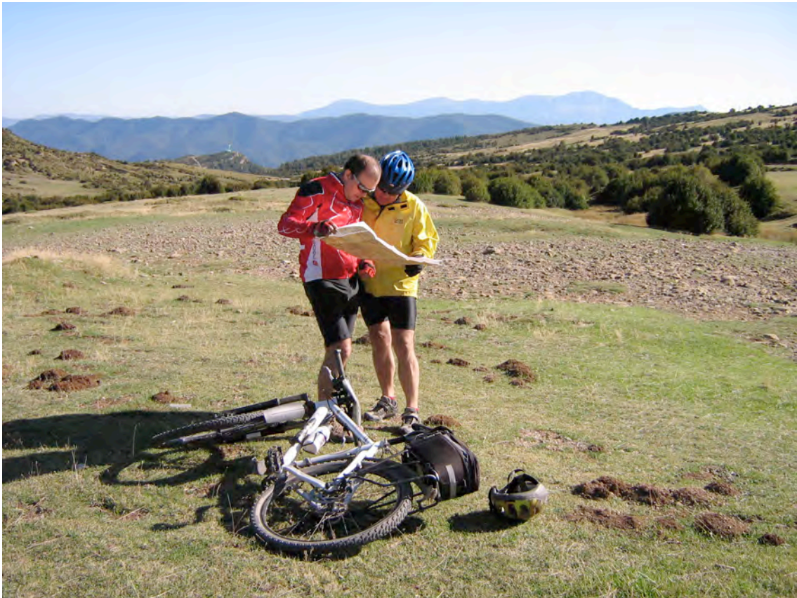
Consultant el mapa en el pla de Santa Orosia