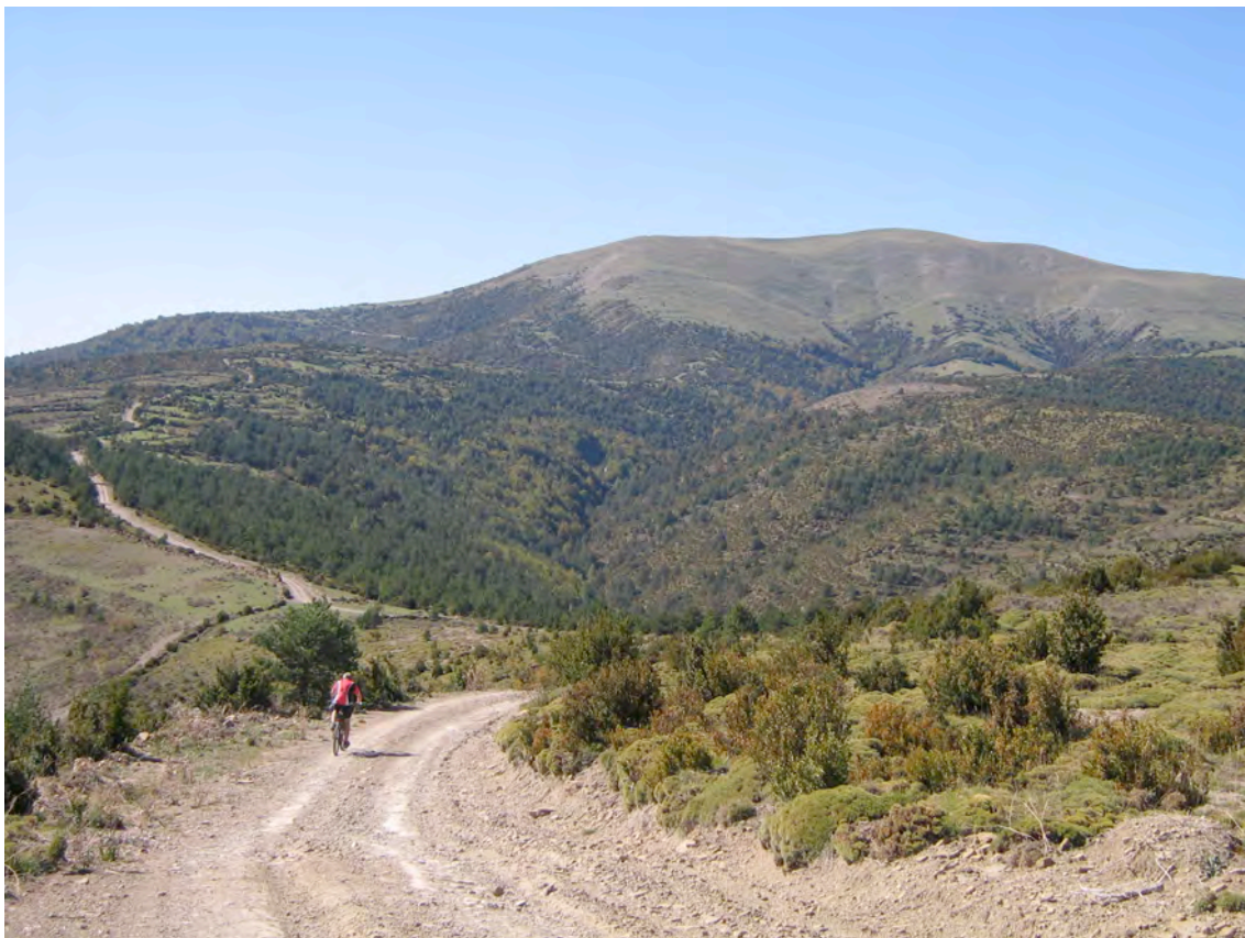
El cim de la Peña Oturia (1921 m)