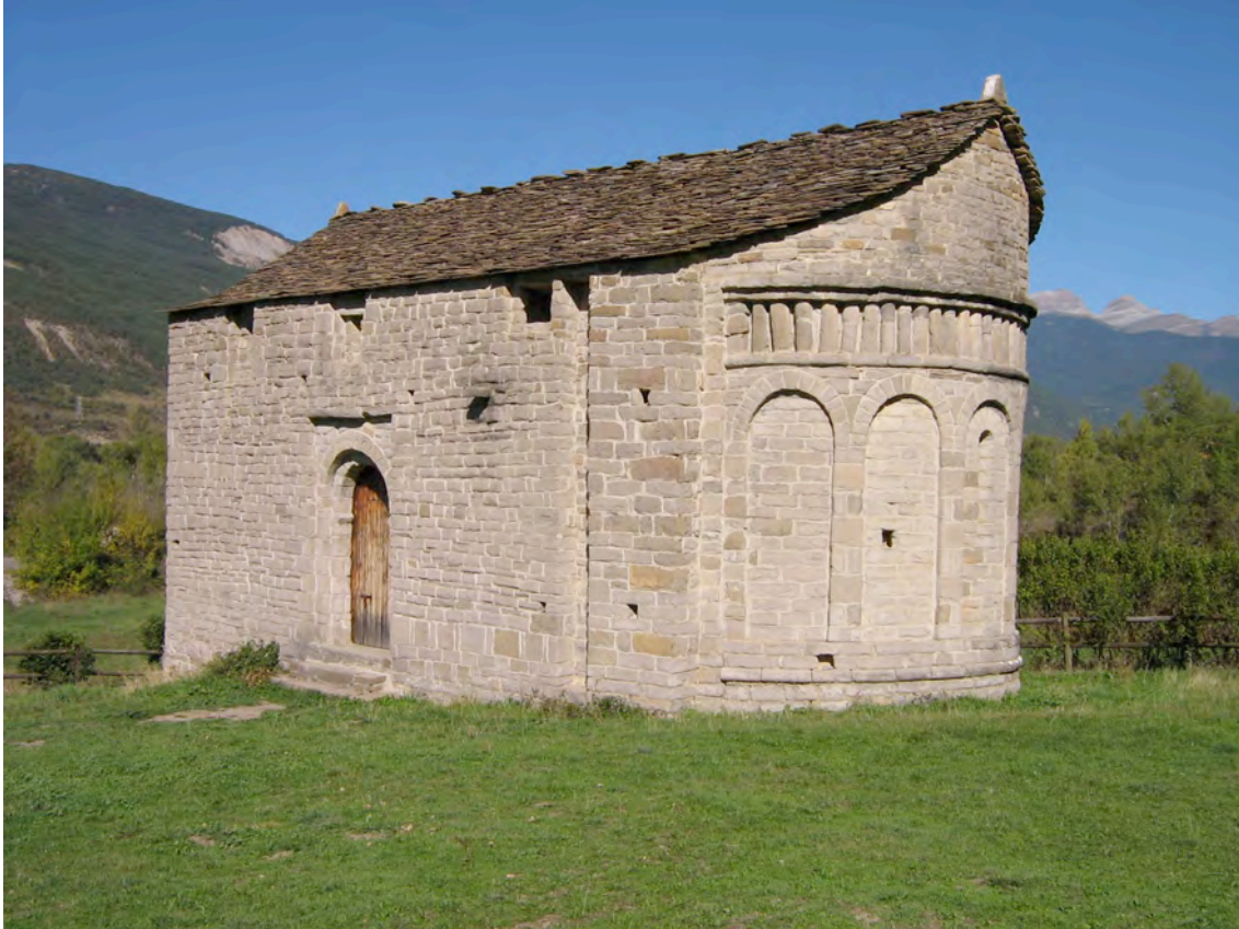
Ermitea mossàrab de San Juan de Busa