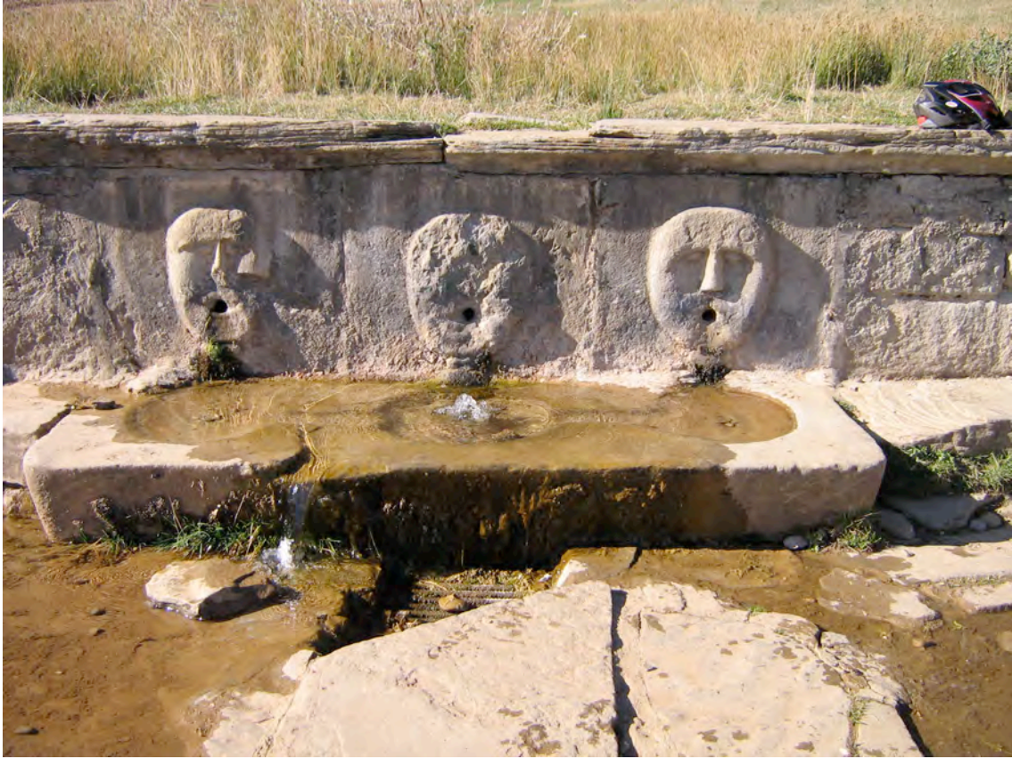
Font del santuari de Santa Orosia