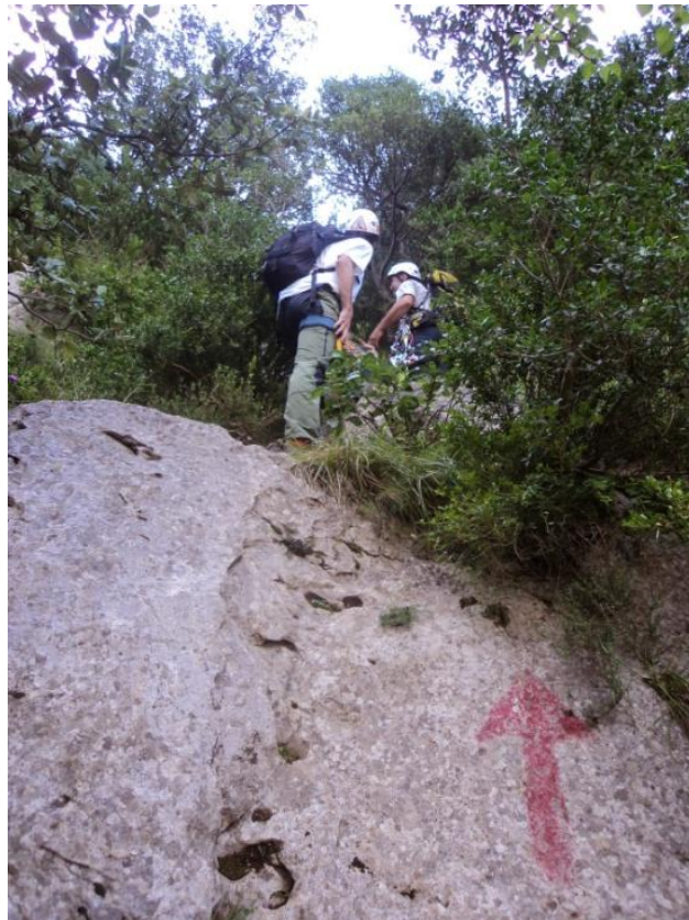
Marca que ens indica el punt on deixem el Camí per començar la cresta

Just en arribar a un punt on hi ha un petit mur de pedra a la nostra dreta on podem veure just a sota nostre la Riera d'Oix, veiem el primer senyal (Fletxa vermella) que ens marca l'inici de la cresta.