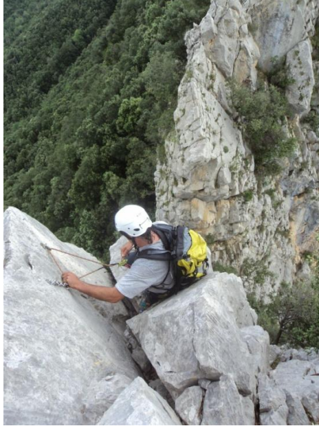
Inici del ràpel a la meitat de la cresta

Un cop passat el primer coll, la cresta perd verticalitat per pujar al segon dels pics, i en passos de IIº amb molts arbres on es poden col·locar ancoratges arribem al ràpel que hi ha a la meitat de l'itinerari. Una reunió amb 2 parabolts amb anella ens indiquen el punt exacte. Aquest ràpel, (25 metres) el farem lleugerament desviats a la dreta de la reunió, per un petit diedre que ens portarà directament al coll per continuar amb la cresta.