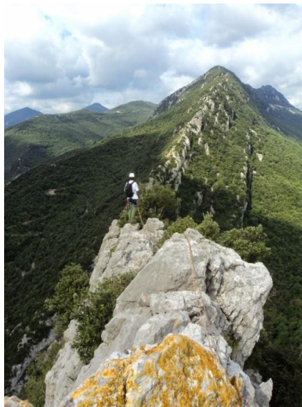
Enfilats al fil de la cresta al primer tram

A partir d'aquí, en passos de II o i III o seguim l'estreta i àeria cresta fina a arribar a un primer coll, on vam haver de plegar la primera vegada per culpa de la pluja. És una escalada fàcil però àeria entre els grans blocs de pedra calcària on sempre en trobem algun que es mou una mica i per això haurem d'anar en compte.