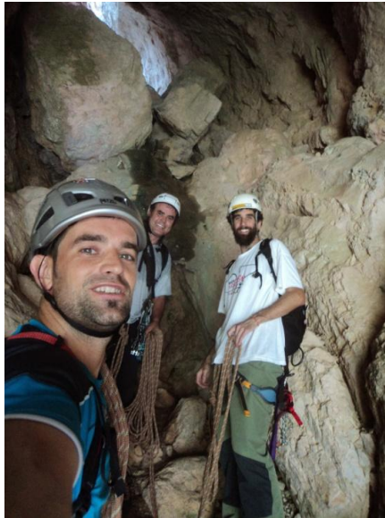
Dins del túnel a l'inici de la Cresta de Ferran

Just a la part de sota del gran diedre, trobem un parabolt que ens indica l'inici de la via. De d'aquí, pujem directe per anar resseguint el diedre per la seva part més interior amb bones preses i passos de III o . A la dreta, a pocs metres de la sortida del diedre, ens trobem una de les curiositats de la via, un immens túnel que hem de creuar pel seu interior. Un cop a dins, sortim per la seva segona obertura a l'esquerra per anar a parar, ara si, al fil de la cresta, que ja no deixarem fins al cim del Ferran.