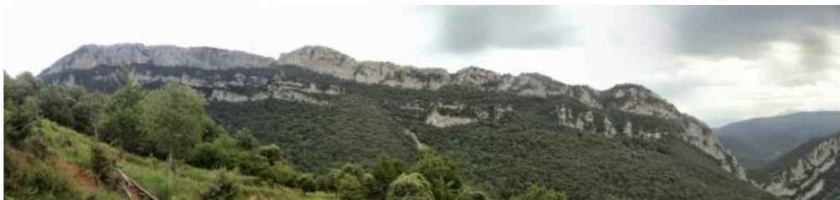
Vista de la cresta de Ferran des de la seva vessant Nord

Des del cim. baixarem en direcció Est seguint un fresat camí que es desvia de seguida cap a l'esquerra per anar a baixar pel mig del bosc cap a Talaixà. Des del nucli despoblat de Talaixà, ens desviem a l'esquerra resseguint la cresta per la seva vessant Nord seguint les marques grogues (Oix) i el GR 11 (Beget) fins a tornar a la palanca de Samsó per tornar a prendre el camí de tornada cap al cotxe (1 hora).