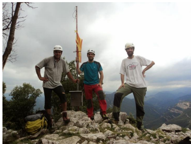
La cordada sencera al cim del Ferran, després de fer la cresta

Un cop fet aquest ràpel, ens tornem a encordar per continuar la cresta, i és aquí on hi ha el pas més complicat de la cresta, un pas de IVº, que és d'uns 15 metres, però que estem obligats a passar si volem continuar la cresta. Iniciem el pas lleugerament desviats a la dreta per posar un ancoratge en un petit arbre i continuar, aquest cop cap a l'esquerra per sobre d'un gran bloc amb una fissura a la part alta. Un cop superat aquest bloc, tornem a seguir cap a la dreta per passar entre uns grans blocs una mica inestables i continuar resseguint per la cresta ja amb trams de corda fàcils de IIº. Un cop passat el segon petit pic, just a un coll ample ple d'arbres, ja ens desencordem per fer l'últim tram de la cresta, que el farem caminant entre blocs de pedra lleugerament desviats per la vessant sud de la cresta fins a arribar al Pic de Ferran, a 983 metres.